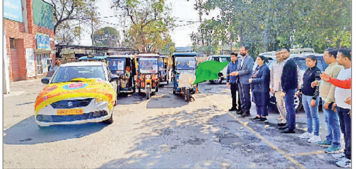
सोनीपत। अस्पताल परिसर में जागरूकता रैली को हरी झंडी दिखाकर रवाना करते हुए।

रविवार 3 मार्च से 05 मार्च मंगलवार तक जिला के 0 से 5 साल तक के सभी बच्चों विशेष पोलियो अभियान के तहत सोनीपत को बूथ पर पोलियो ड्रॉप पिलाई जाएगी।