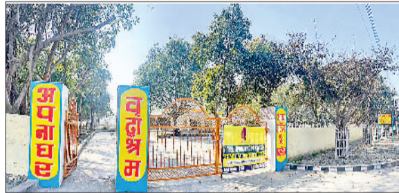
सोनीपत। सेक्टर 7 के क्लब को संस्था द्वारा टेकओवर करने के बाद तैयार किया गया वृद्धाश्रम।

धार्मिक ग्रंथों से लेकर बड़ों-बुजुर्गों की कहावतों तक में बुजुर्गों की सेवा करने को बहुत बड़ा पुण्य माना गया है। लेकिन सोनीपत शायद इस पुण्य से वंचित ही रहना चाहता है। सुनने में थोड़ा अजीब है, लेकिन इसे समझते हैं। 16 लाख से अधिक की आबादी वाले सोनीपत में अगर प्रदेश का वरिष्ठ नागरिकों का 7.6 प्रतिशत का औसत भी गिना जाए तो जिले में वरिष्ठ नागरिकों की संख्या डेढ़ लाख से अधिक हो जाती है। सीधे तौर पर 1.5 लाख के करीब बुजुर्ग सोनीपत में निवास कर रहे हैं। इतनी बड़ी संख्या में बुजुर्गों के रहते हुए भी जिले में एक अदद सीनियर सिटीजन क्लब नहीं, सरकार या प्रशासन द्वारा बेसहारा बुजुर्गों के लिये कोई वृद्धाश्रम नहीं है। नाम के लिये एक सीनियर सिटीजन क्लब सेक्टर 7 में बनाया गया था। सालों रख-रखाव के अभाव में खंडहर हो चुके इस क्लब का उद्धार भी पिछले दिनों एक सामाजिक संस्था ने ही किया था। सामाजिक संस्था ने 5 लाख रुपये की राशि खर्च कर इस क्लब का पुनर्निर्माण करवाया और अब यहां वृद्धाश्रम शुरू किया गया है। इसके अलावा जिले में विभिन्न सेक्टरों में बने कम्यूनिटी सेंटरों को