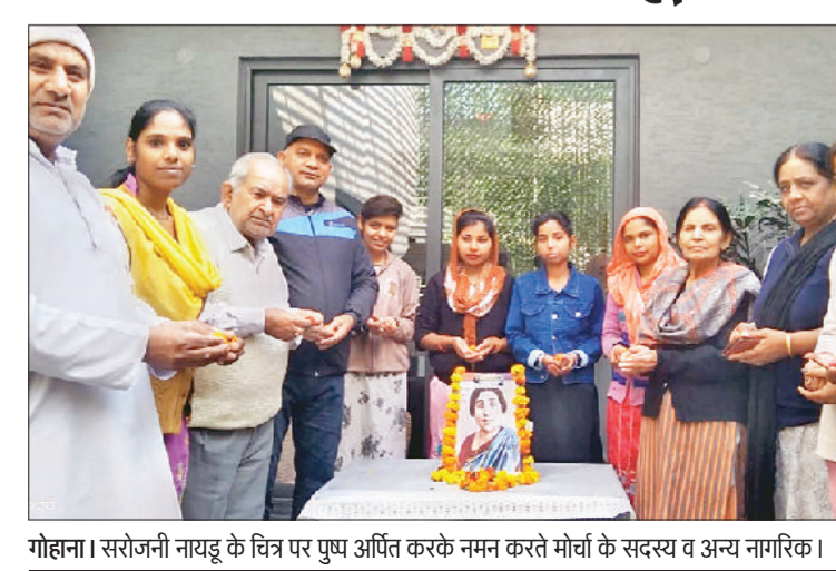
गोहाना। सरोजिनी नायडू के चित्र पर पुष्प अर्पित करके नमन करते मोर्चा के सदस्य व अन्य नागरिक।