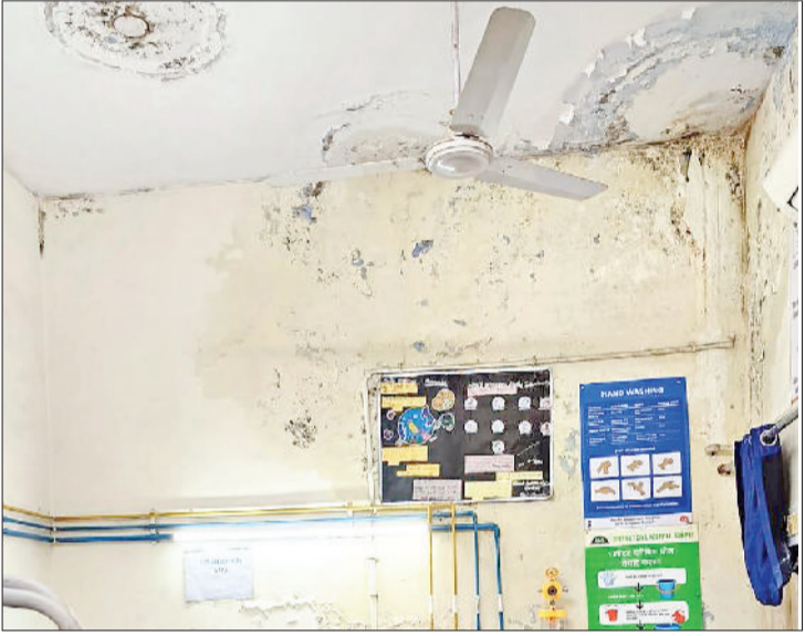
सोनीपत। छत से टपक रहा पानी।

नागरिक अस्पताल सोनीपत में प्रबंधन की लापरवाही के चलते आपातकालीन कक्ष में तैनात चिकित्सक व कक्ष में आने वाले मरीजों को उठाना पड़ रहा है। कक्ष में एक मात्र बेड के लघु आप्रेशन कक्ष में छत से कई दिनों से पानी टपक रहा है। कक्ष में तैनात स्वास्थ्य कर्मचारियों को पानी टपकने की समस्या से निजात पाने के लिए कई बार प्रबंधन को अवगत करवाया। प्रबंधन की तरफ से जल्द से जल्द इमारत की छत से टपक रहे पानी को रोकने के लिए कदम उठाने की बात कही जा रही है। पानी टपकने से अस्पताल की इमारत जर्जर होती जा रही है। वहीं पानी की वजह से बिजली की तारों सहित अन्य उपकरणों में करंट तक आने लगा है। जिसके चलते कर्मचारी जान जोखिम में डालकर काम करने पर मजबूर है। बता दें जिले का नागरिक अस्पताल 200 बेड की सुविधा है। अस्पताल की इमारत काफी जर्जर हो चुकी है। जिसके चलते कई हिस्सों में पानी टपकने व सीलन की समस्या का सामान प्रबंधन को करना पड़ रहा है। मरीजों के उपचार करने वाले अस्पताल को खुद के उपचार की आवश्यकता है। अस्पताल का आपातकालीन कक्ष खुद बीमार पड़ा हुआ है।